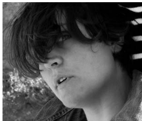
Gaëlle Hyernaux Composition et arrangements